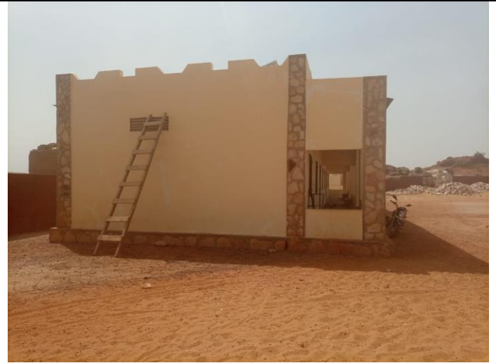
Ecole réhabilitée dans la commune de pignari-Banan (village de Bandiougou)

08 forages réalisés dans 03 communes notamment Dandoli (03), Doucombo (02), Pignari-Bana (03)