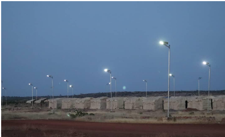
Image site des déplacées à Bandiagara

Les activités relevant du produit portent sur la construction de 60 abris en 2022 pour 240 déplacés, accompagnés d'une dotation en kits d'énergie solaire (lampes et batteries solaires) dans la commune de Bandiagara.