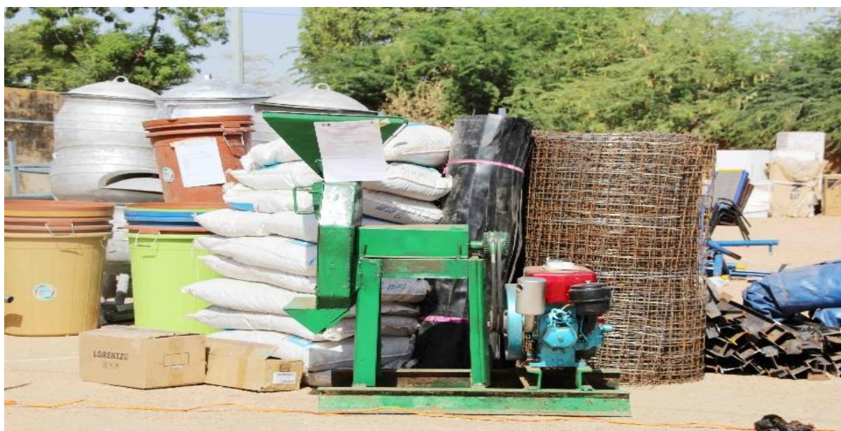
Image des matériels de production remis aux 31 groupements