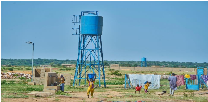
Image d'Adduction d'eau dans la commune de Bandiagara

08 forages réalisés dans 03 communes notamment Dandoli (03), Doucombo (02), Pignari-Bana (03)