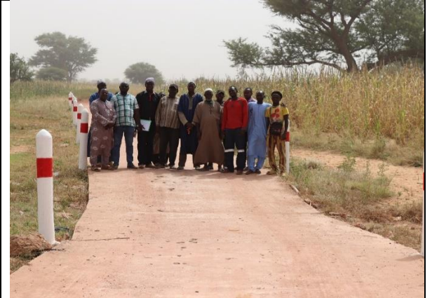
Radier du village de Kori-Kori (Goundakaka) dans la commune de Pignari-Bana