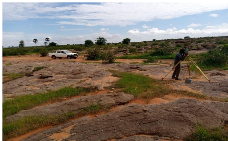
6km de piste rurale de la commune de Pignari-Bana