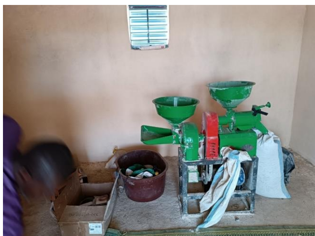
Image plateformes multifonctionnelle de Bandiagara

Les plateformes multifonctionnelles dédiées aux femmes participent à la réduction du temps de travail face aux moyens rudimentaires utilisés avant la mise en œuvre du projet. Elles sont réparties dans les communes d'intervention Bandiagara, Dandoli, Durou, Doucombo et Pignari-Bana et requiert un intérêt dans l'économie de temps de ces bénéficiaires qui font face aux doubles tâches notamment ménagères et activités économiques.