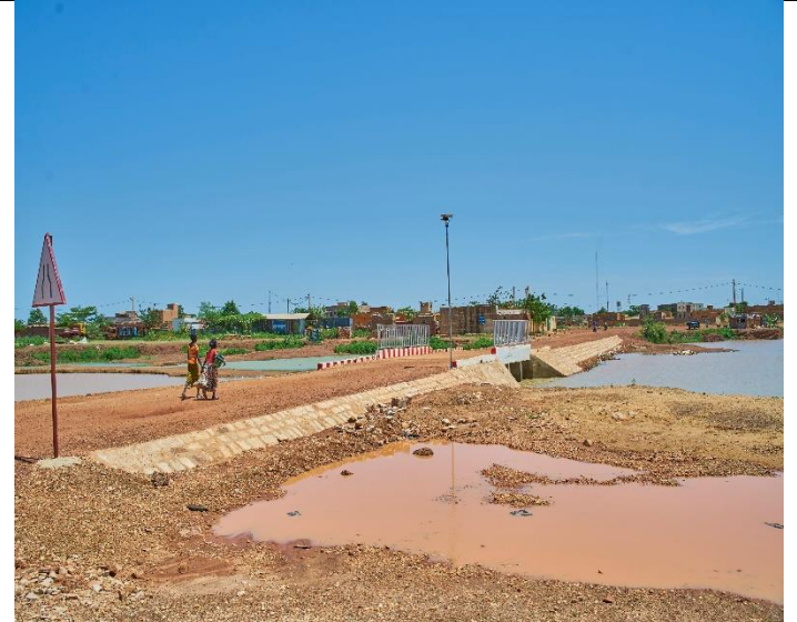
Dalot du village de Kakoli dans la commune de Pignari-Bana